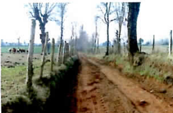
Reparación camino Vecinal cruce Darío Feris, 2.7 kms aprox, sector Trehualemu Norte, 2000 m 3