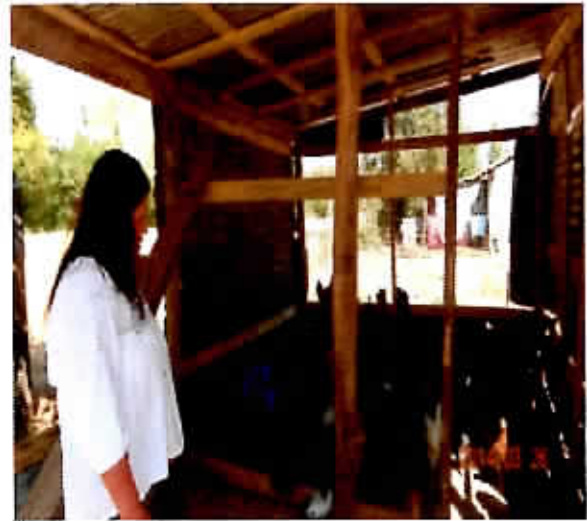
Ejemplo, iniciativa ganadora, crianza de gallinas y venta de huevos