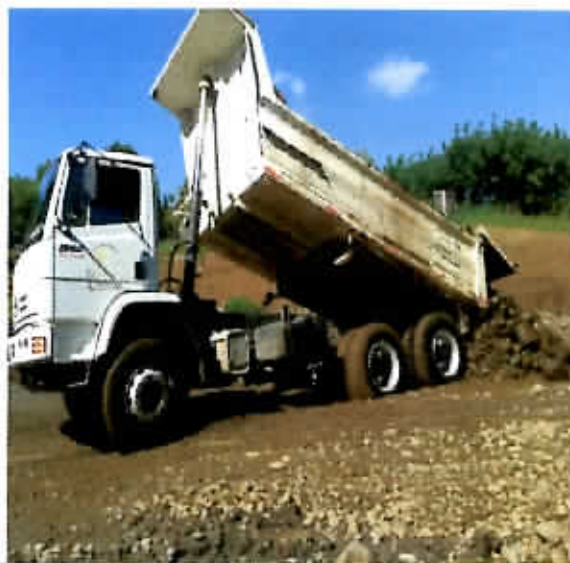
Reparación Playa de Estacionamientos