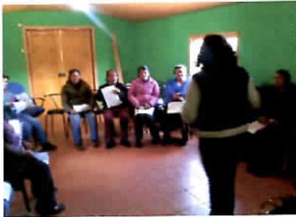
Taller: Alianza ingreso ético familiar