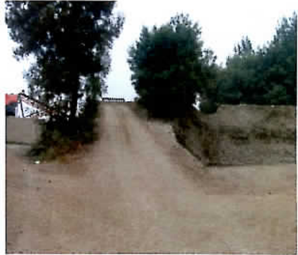
Traslado de material desde pozo lastrero sector Las Quilas y acopio de material granulado en planta chancadora municipal