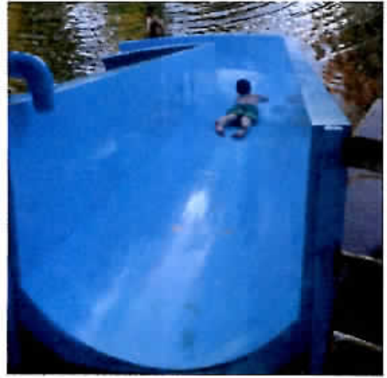
Instalación tobogán con bomba de agua y cama elástica de agua