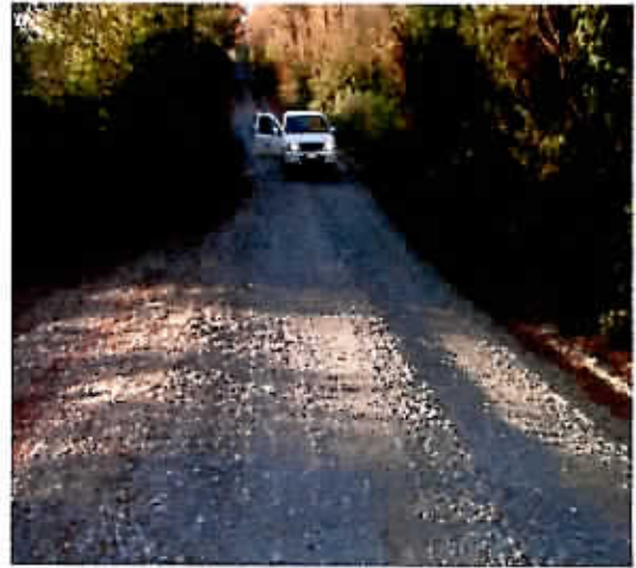
Reparación camino público enrolado por vialidad de acuerdo a convenio n° 2 camino Labraña 2.0 kms aprox, 2.000 m3.