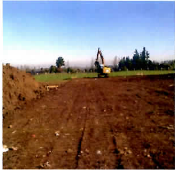
Proyecto Plan de cierre ex Vertedero Municipal