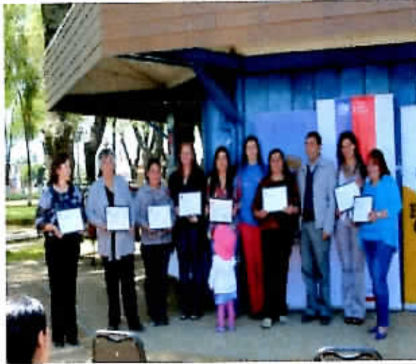
Entrega certificados Fondo Concursable Municipal, Capital Semilla 2013