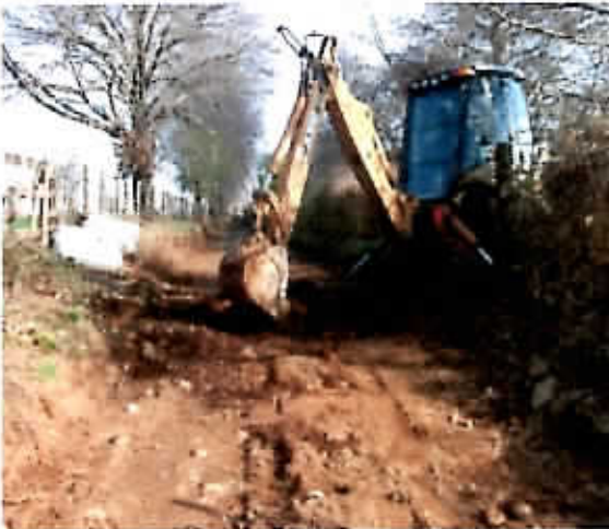
Instalación alcantarilla camino vecinal Darío Feris