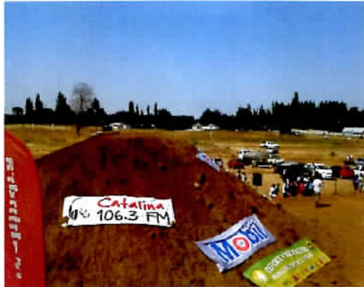
Confección cancha y rampa de acceso actividad "enducross", sector 16 de julio