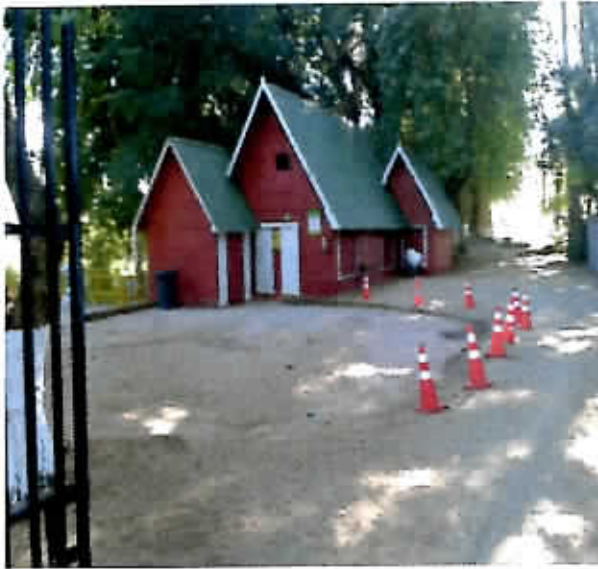
Habilitación infraestructura existente, baños, camarines, fosa séptica y drenes, kiosco