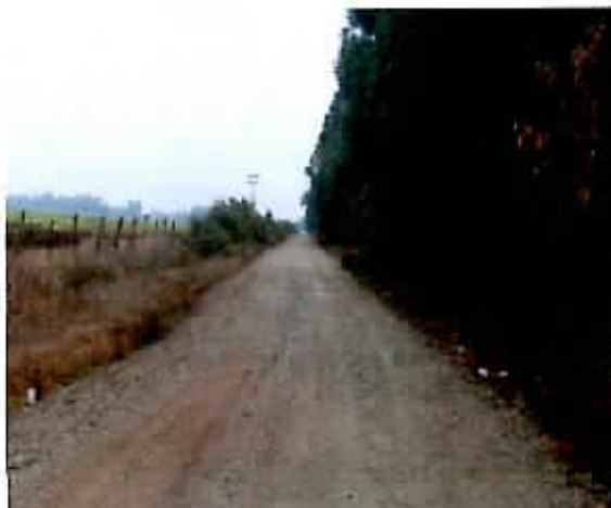
Reparación camino público enrolado por vialidad de acuerdo a convenio n° 2 camino Lo Vergara 2.0 kms aprox, 2.000 m3.