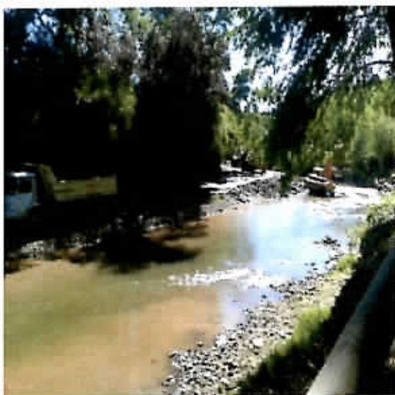
Trabajo de limpieza Estero Temuco