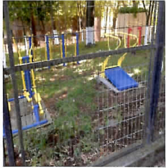
Instalación de máquinas de ejercicios