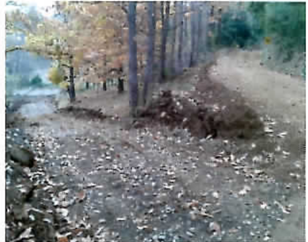
Reparación camino San Vicente Bajo

Reparación camino Capilla Norte San Antonio, 3.0 kms aprox. 2000 m 3